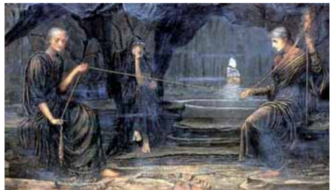
John Melhuish Strudwick, A Golden Thread, 1885 (Wikimedia Commons, public domain US)

verschillende Griekse tragedies. Het is en blijft boeiend om te beleven hoe de Griekse tragedieschrijvers grote menselijke dilemma's op een uiterst kunstzinnige wijze in een mythologische en dramatische setting wisten uit te werken, zodat het toen en nu nog steeds velen fascineert. Tijdloos.