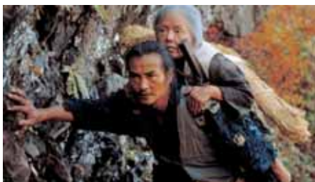
Filosofisch café 28 juni 2020: 'Overleven' met de film 'The ballad of Narayama'