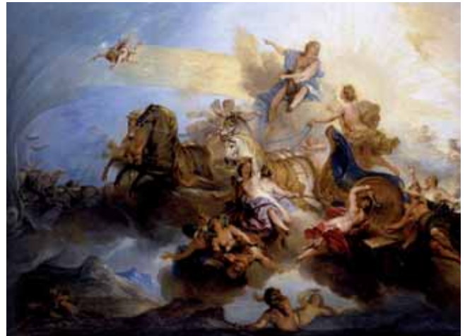
Nicolas Bertin, - Phaëton op de zonnewagen van Helios - c. 1720 (Wikimedia Commons – Public Domain)

Het was ons lot deze cursusweek te worden ondergedompeld in maalstroom van afwisselende presentaties en teksten lezen van de oude Grieken. En dat was zeker geen slecht lot dat de schikgodinnen voor ons bedacht hadden. De presentaties van Moïra waren zeer interessant en werden op een enthousiaste wijze gegeven. Ze gaven ons in vogelvlucht een introductie in de oorsprong en geschiedenis van de Griekse mythologie en veelvuldig kregen we teksten te lezen van Griekse auteurs, waaronder grote namen zoals Homerus, Heiodos, Europides, Sofokles, etc. Zeer aanstekelijk was het gezamenlijk hardop lezen van de fragmenten uit