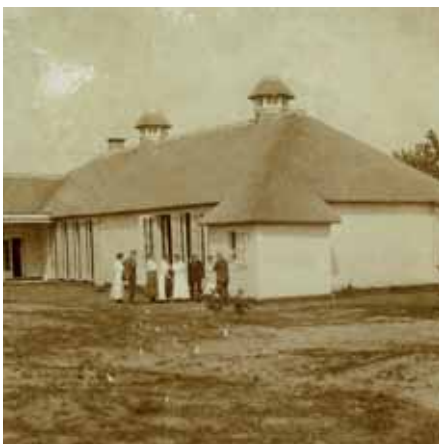
Achtergevel van het hoofdgebouw in 1924