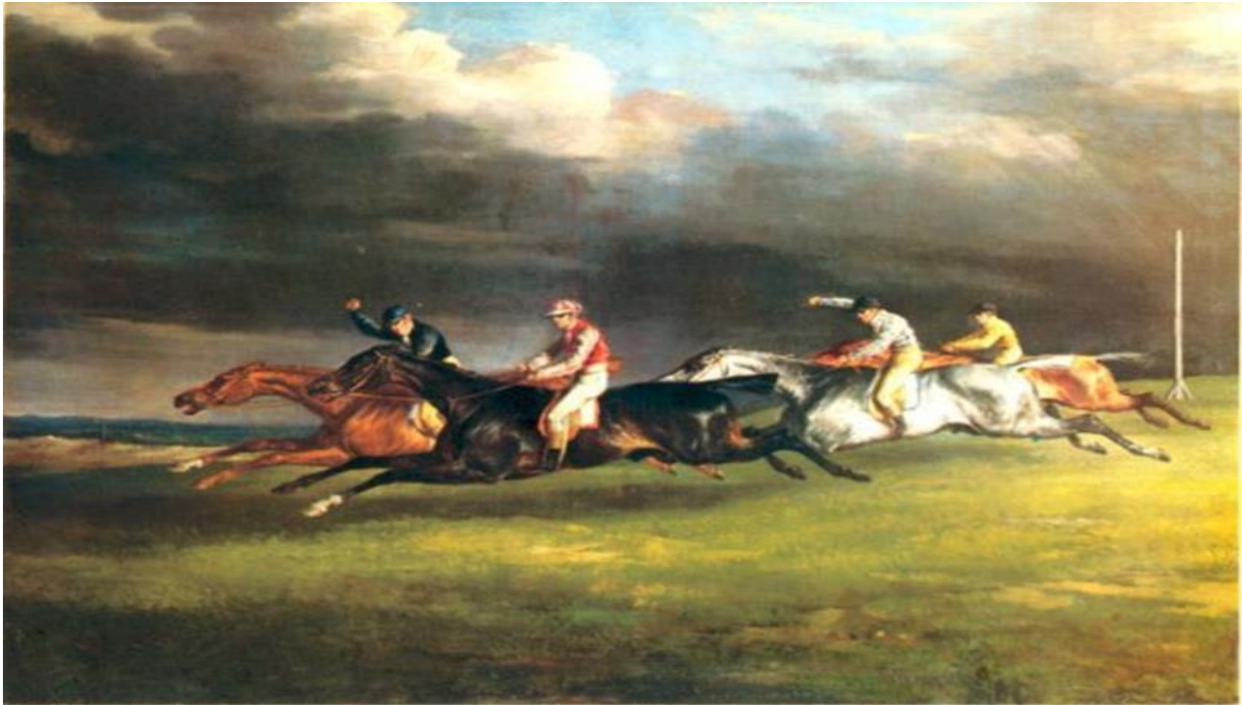
Théodore Géricault, De Epsom Derby in 1821 1821, olieverf op doek, 92 x 122.5 cm